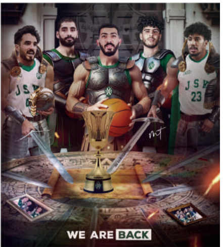
الشبيبة الرياضية القيروانية-فرع كرة السلة.. حلّة جديدة وانطلاق موسم رياضي مليء بالتجديدات !