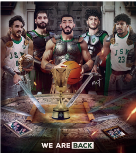
الشبيبة الرياضية القيروانية-فرع كرة السلة.. حلّة جديدة وانطلاق موسم رياضي مليء بالتجديدات !