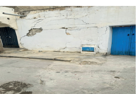
تسريب مياه الصنود بحي الشباب

منذ عام تقريبا، تظنن سكان حي الشباب بالقيروان إلى تسرب مياه "الصنود" بطريقة واضحة مما جعلهم يتصلون بالشركة التونسية لاستغلال و توزيع المياه لإصلاحها بالخل، و لكن لا من إجابة لمطلبهم أو حتى إهارة أمرهم اهتماما رغم تحول المعنيين بالأمر مرفوقين بمعتمد القيروان الشمالية على عين المكان. و قد أدى هذا الأمر إلى تداعي منزل للسقوط. وهنا عندما تقطنت البلدية لذلك، أمرت بهدم المنزل